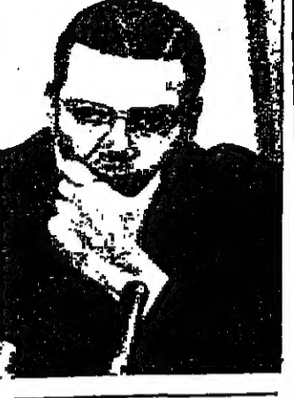
غرام من الحشيش لكل وزير دانمركي

واشنطن - رويتر - نخل المستر روبرت مكثارا وزير الدفاع الأميركي أمس عن منصبه كرئيس أكبر مؤسسة عسكرية في العالم ليكرس وقته للامام الاقتصادي السلمي . وسيتولى المستر مكثارا الذي يبلغ من العمر ٥١ سنة والذي بطله عقلا سرعا كاتلة الخاصة منصبه الجديد كرئيس للبيك الدولي بعد اجازة تستمر شهرا واحدا . وقد اتفق المستر مكثارا رئيس شركة غورد مونتورز السابق خصل السنوات السبع التي قضاها في وزارة الدفاع ٣٥٥ الف مليون دولار على شؤون الدفاع وابدع الولايات المتحدة عن سياسة الرد القاري الجماعي